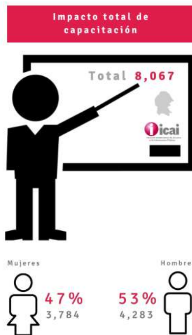
Infografía 5. Impacto total de la capacitación del ICAI.

A fin de afianzar estos temas dentro del Estado de Coahuila, este año se realizaron jornadas de trabajo dirigidas a sujetos obligados en los 38 municipios, logrando más de ocho mil capacitaciones