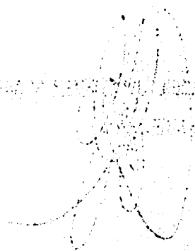
Diagram illustrating the structure of a stem cross-section, showing vascular bundles arranged in a ring. The diagram is labeled with various parts: 1. Pith 2. Primary xylem 3. Secondary xylem 4. Vascular cambium 5. Secondary phloem 6. Primary phloem 7. Cork cambium 8. Cork